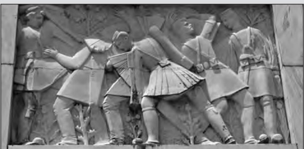
Το ηρώο των Μπιζανομάχων είναι έργο του γλύπτη Λάζαρου Λαμέρα και εκτελέστηκε το 1963.