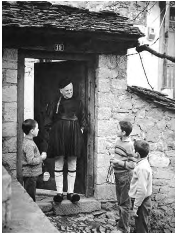
Τοῦ Φώτη Κόντογλου

ἔχουνε τὴ ρίζα τους στὴ θρησκεία, ἦτανε σεμνές, πνευματικές, ὥστε νά μὴ σκανδαλίζουνε τοὺς φτωχοὺς, ὅσο εἶναι μπορετὸ σέ σαρκικούς ἀνθρώπους. Οἱ πλούσιοι κ' οἱ νοικοκυραῖοι ἀποφεύγανε νά πληγώσουνε τοὺς φτωχότερους, καὶ νοιώθανε τὴν ἀνάγκη νά τοὺς ζεστάνουνε καὶ κείνους, στέλνοντας κρυφὰ στὰ σπίτια τους διάφορα δῶρα, μὲ τρόπο, ὥστε νά μὴ τοὺς ταπεινώσουνε, κ' ἔτσι ἡ διαφορά νά φαίνεται ὅσο μποροῦσε λιγώτερη.