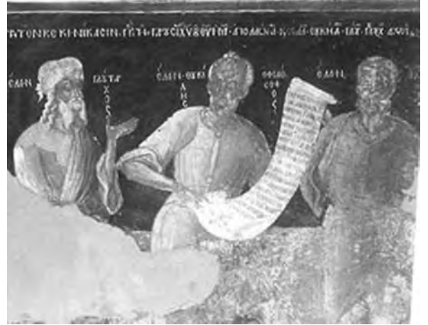
Πλούταρχος, Θουκυδίδης, Χείλων

λοιπόν να τον σέβεσαι και να τον αντιλαμβάνεσαι. Διότι είναι άσεβης αυτός ο όποιος θέλει σύμφωνα με τον νουν να εξακριβώσει τον Θεό».