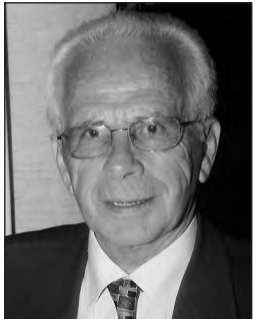
Γράφει ο Στέφανος Κων. Γιωτάκης Ηλιούπολη 26 Σεπτεμβρίου 2017