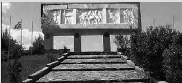
Το μνημείο των Μπιζανομάχων στο Μπιζάνι