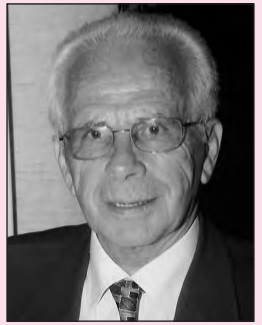
Γράφει ο Στέφανος Κων. Γιωτάκης

Για τη γέννηση του Ιησού Χριστού ο Ευαγγελιστής Ματθαίος (κεφ.Α στιχ.18-23) γράφει «Του δε Ιησού χριστού η γέννηση ούτως ην. Μνηστευθείς γαρ της μητρός αυτού Μαρίας τω Ιωσήφ, πριν η συνεληθείν αυτούς, ευρέθη εν γαστρί