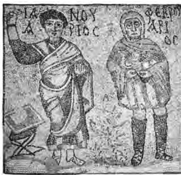
Ιανουάριος και Φεβρουάριος. Ψηφιδωτό σε ιδιωτική έπαυλη του 6ου αιώνα μ.Χ. κοντά στο Αρχαίο Θέατρο Άργους

Ο Ιανουάριος παριστάνεται ως ύπατος με χιτώνα και ιμάτιο. Από το υψωμένο δεξί του χέρι —στο οποίο κρατά τη λεγόμενη mapra circensis δηλαδή μαντήλι με το οποίο δινόταν το σήμα της εκκίνησης στον Ιππόδρομο— αφήνει να πέσουν χρυσά νομίσματα. Η απεικόνιση του Ιανουαρίου