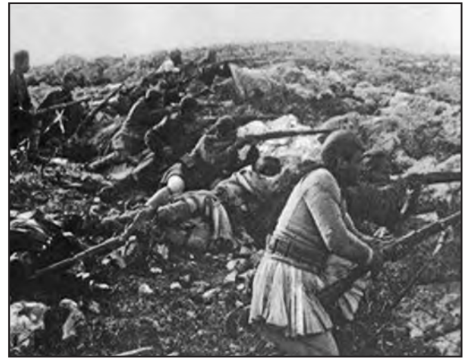
Η μάχη της Μανωλιάσσης

Α') Τμήμα Στρατιάς δεξιού. Επί της Αετορράχης επεκράτει ψύχος δριμύτατον, χιών δε πίπτουσα συνεχώς εδυσχεραίνε πάσαν κίνησιν. Εις το μέτωπον της VI Μερραρχίας ουδεμία επί τα πρόσω κινήσις ήτο δυνατή, λόγω της εξαντλήσεως των ανδρών. Το πυροβολικόν του αποσπάσματος της Μερραρχίας ταύτης και το II) 17 ου τάγμα αλλήσσοντα θέσιν κατά την νύκτα της 9 προς την 10 Ιανουαρίου με τον σκοπόν να εγκατασταθώσι, συνεπεία διαταγής του διοικητού του αποσπάσματος, επί των βορείως του Ελληνικού υψωμάτων, περιέπεσον εις αταξίαν ένεκα αναμίξεως μετά των ανδρών του