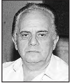
Γράφει ο Κώστας Ε. Γιαννούλας Σχολ. Σύμβουλος Δ.Ε. Πτυχιούχος Φ.Π.Ψ.