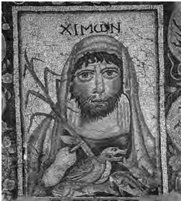
Ο Χειμώνας ως γενειοφόρος ώριμος άνδρας. Ψηφιδωτό από τη περιοχή του Αγίου Ταξιάρχης Άργους.

Η κύρια παράσταση του είναι οι προσωποποιήσεις των τεσσάρων εποχών, που απεικονίζονται ως προτομές και ταυτίζονται με επιγραφές. Ακέραιος έχει διασωθεί μόνο ο χειμώνας (ΧΙΜΩΝ) που αποδίδεται ως γενειοφόρος ώριμος άνδρας σε κατά μέτωπον στάση, με εκφραστικά